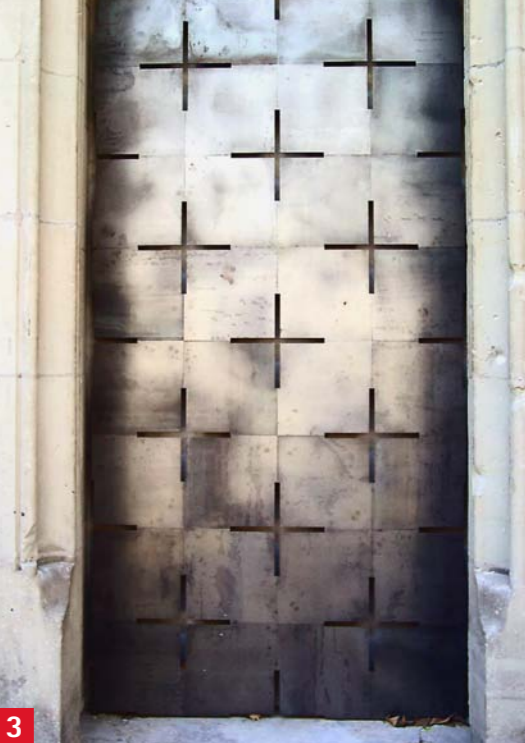
Scheintür am Nordportal