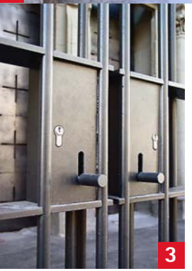
Gittertor, Detail Verschluss