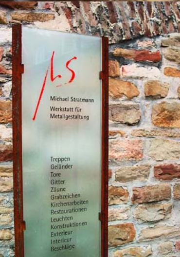
Abb.: Stand der Werkstatt für Metallgestaltung auf der Deubau 2006

»Hochbau. Ausbau. Tiefbau. DEUBAU – Creating Future« unter diesem Leitgedanken steht die 23. Internationale Baufachmesse in Essen. Die DEUBAU 2008 ist die Kommunikationsplattform Nummer 1 des Jahres für die gesamte Bauwirtschaft. Rund 750 Aussteller aus 16 Nationen werden den über 75.000 Besuchern ihre aktuellen Produkte, Verfahren und Dienstleistungen vorstellen. Die DEUBAU präsentiert einen Überblick über das aktuelle Angebot an Neuheiten und Trends in allen Bereichen des Planens und Bauens. Wir freuen uns über Ihren Besuch auf unserem Stand Halle 2 Standnummer 527 .